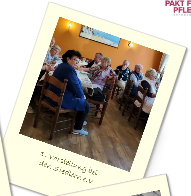
1. Vorstellung bei den Siedlern e.V.