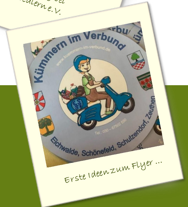
Erste Ideen zum Flyer ...