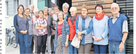
Viele Anwohner haben im Internet abgestimmt und drücken dem Wittstocker Quartier die Daumen.