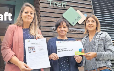
Die Jury hat die besten Projekte in Deutschland ausgewählt.