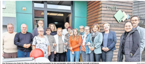
Die Pfleger des Pakts für Pflege übernehmen das Quartiersmanagement für die Röbbeler Vorstadt in Wittstock.