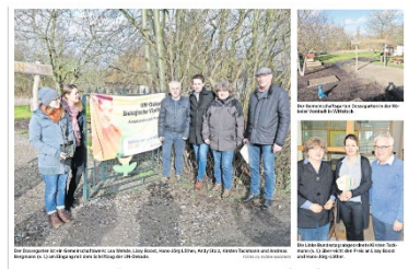
Ausgezeichneter Gemeinschaftsgarten Der Dossegarten in der Röbeler Vorstadt in Wittstock bekam den Preis der UN-Botschafterin für ökologische Vielfalt