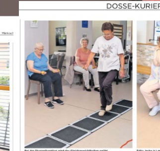
Bei der Streifenarbeit wird das Gleichgewicht gehalten.